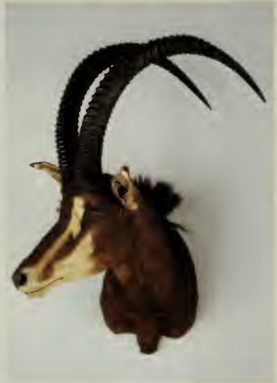
A sinistra: Lichi ( Kobus leche Gray, 1850); a destra: Antilope nera ( Hippotragus niger Harris, 1838).